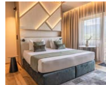
Wohnbeispiel Familienzimmer mit Verbindungstür